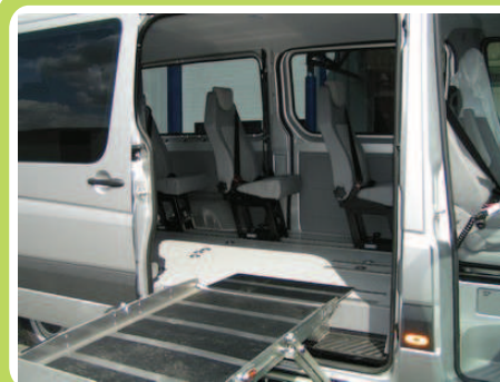
Accès latéral par cassette sous plancher