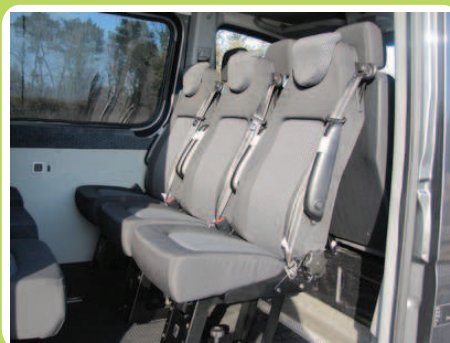
Sièges amovibles JANY