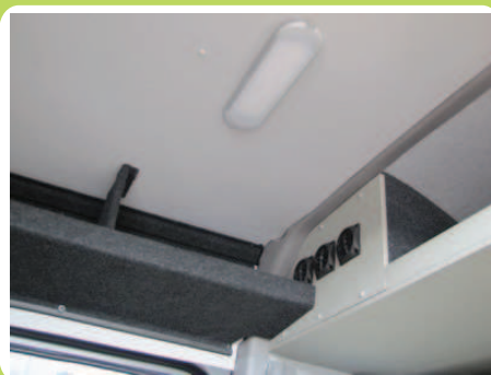
Climatisation en capucine et porte-bagage

Nombreuses possibilités d'aménagement : quelques exemples ci-dessous