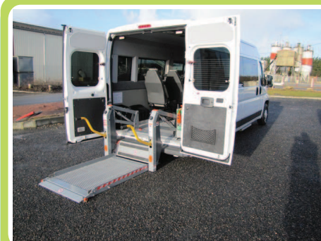
Accès arrière par hayon élevateur : version maxi pratique