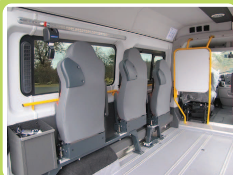
Sièges rabattables en paroi Arrimage sur plancher alu