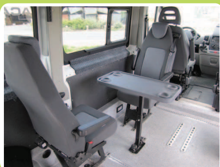
Sièges et tablette amovibles Arrimage sur rails Q'Straint

Nombreuses possibilités d'aménagement : quelques exemples ci-dessous