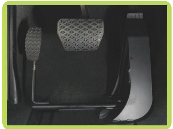
Inversion de pédale au plancher, démontable rapidement.