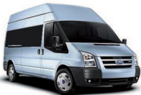
Réf produit : TFOTRAL