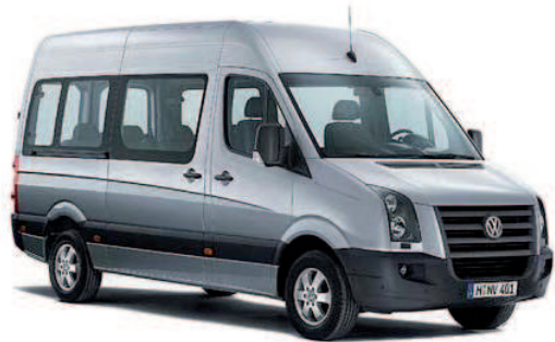
Réf produit : TVOCRAL