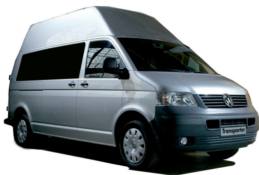
Réf produit : TVOT5L